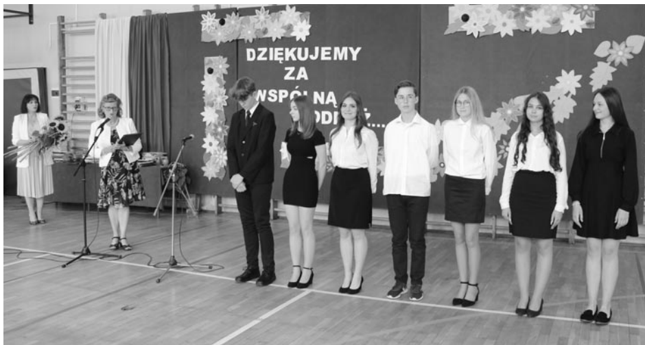
Nominowani do Graduatów Sunt Optima

Gość odwiedzający w czerwcu naszą szkołę mógłby odnieść wrażenie, że trwa pandemia, a część uczniów pracuje w swoich domach zdalnie. Szkoła prawie pusta, pozbawiona naturalnego gwaru, widoku dużej liczby przemieszczających się w szybkim tempie uczniów, bez wątpienia mogłaby rodzić naturalne skojarzenia z nauką zdalną. Nic bardziej mylnego. Nie w tym roku szkolnym.