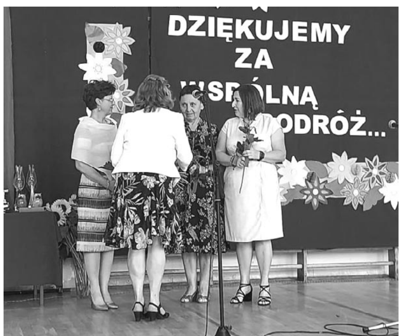
fol. UM Olsztynek