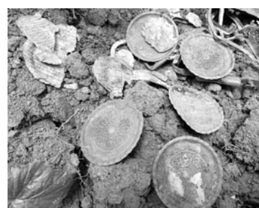
Podkładki pod szklanę z restauracji Tannenberg-Krug

tynie, do którego trafią rzeczy znalezione podczas poszukiwań. Pozwolenie na poszukiwania na podstawie którego działamy w Olsztynku mamy ważne do końca 2022 roku więc z pewnością jeszcze nie raz odwiedzimy to miejsce.