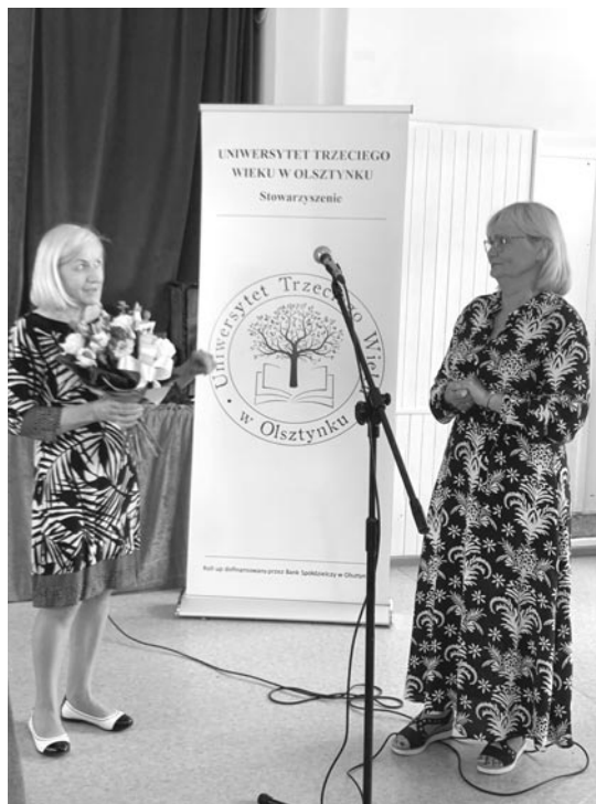
Zakończenie roku akademickiego

Tego typu oznaki utrzymujące się powyżej dwóch tygodni świadczą o chorobie i należy szukać pomocy. Diagnostykę przeprowadza psycholog, psychiatra, a także lekarz pierwszego kontaktu.