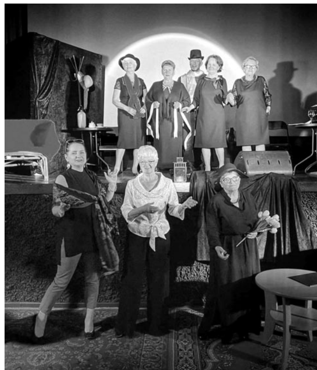
Występ sekcji literackiej w kinie Grunwald

Depresję najczęściej leczy się farmakologicznie bądź podczas psychoterapii indywidualnej lub grupowej. Skutkiem nieleczonoj depresji mogą być próby samobójcze, dlatego