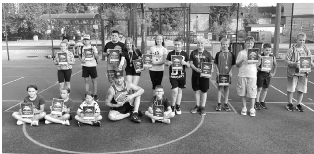
I Olsztyński Turniej Koszykówki Ulicznej