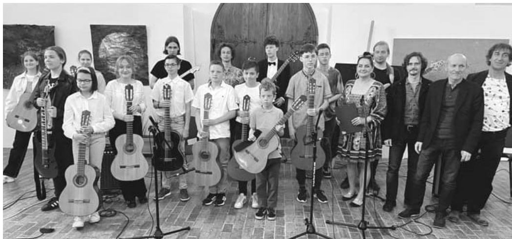
III Konfrontacje gitarowe „Ma Gitarra”

W tym roku, swój debiut jako trener miała Kinga Lewandowska z grupy Streetflow Dance Crew, która od kwietnia trenuje zespół hip hop 16+ no-