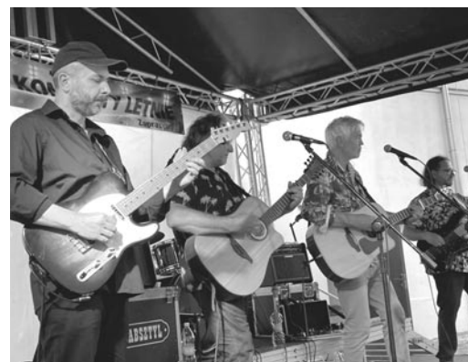
Zespół Babsztyl

29 - 31 lipca - W naszym mieście miał miejsce I Olsztynecki Festiwal Food Trucków , na któ-