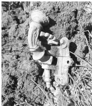
Stare okucie i pierścionek znalezione koło zamku

tego wykopaliliśmy przedmioty z okresu I i II wojny światowej, czasów PRL-u oraz przedmioty współczesne. Wśród odnalezionych artefaktów, najciekawszym obiektem jest bez wątpienia niezidentyfikowane okucie o pięknym zielonkawym nalocie. Być może jest to element kołatki do drzwi lub okucie meblowe. O przeznaczeniu tego przedmiotu rozstrzygnie biegły pracownik Warmińsko-Mazurskiego Urzędu Ochrony Zabytków w Olsz-