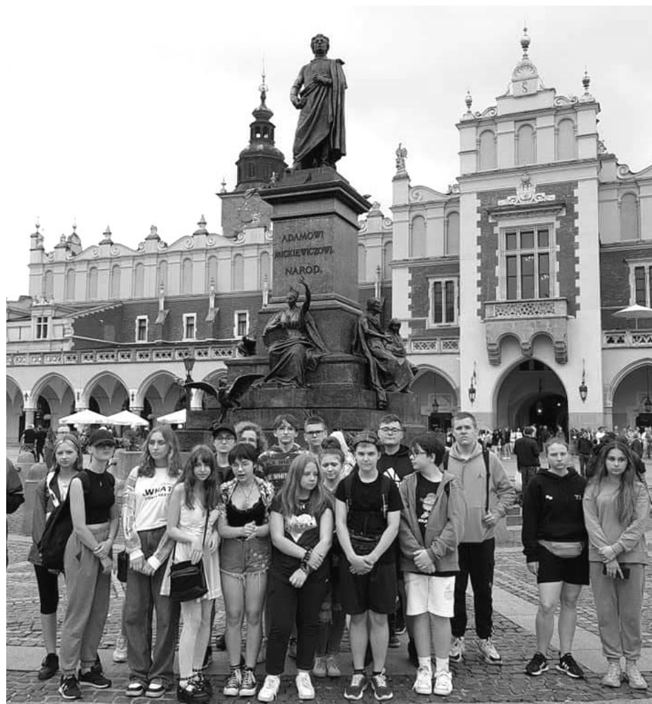
Uczestnicy wycieczki do Krakowa