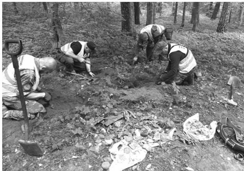
Członkowie sekcji Tannenberg podczas pracy

Obszar ten to nie tylko okres pierwszej wojny światowej. W ramy naszych działań eksploracyjnych wchodzi wszystkie okresy z dziejów Warmii i Mazur. Dlatego też korzystając z okazji planowanej przez Starostwo Olsztyńskie inwestycji związanej z budową w Olsztynku Powiatowego Centrum Sportu i Zdrowia, u zbiegu ulic Olsztyńskiej i Emila von Behringa przeprowadziliśmy poszukiwania zabytków i innych przedmiotów przy pomocy wykrywaczy metali. Teren na którym ma powstać PCSiZ przylega bezpośrednio do olsztyńskiego zamku i mógł obfitować w ciekawe historycznie artefakty. W chwili obecnej nasza sekcja liczy 19 członków, co pozwoliło na szybkie i dokładne zbadanie terenu przed wjechaniem ciężkiego sprzętu i zniszczeniem być może cennych dla Olsztyńka zabytków. Po cichu liczyliśmy na przedmioty związane z okresem, kiedy zamek w Olsztynku był w pełni rozwoju. Zamiast