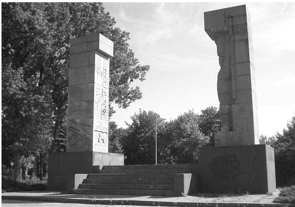
Pomnik Wyzwolenia Ziemi Warmińsko-Mazurskiej w Olsztynie

Należy sądzić, że tak wielki artysta jak Xawery Dunikowski, ukształtowany w duchu patriotycznym dawnej Polski, świadomie nadał taki właśnie kształt temu pomnikowi, żeby jego symbolika przemawiała do uczuć prawdziwych Polaków i ośmieszała komunistyczne władze PRL-u. Nie zamknięty łuk triumfalny przypominał ruiny, dominu-