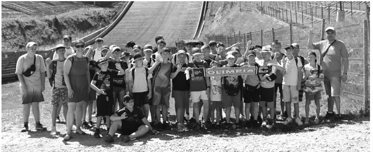
Uczestnicy obozu sportowego pod skocznią narciarską w Zakopanem