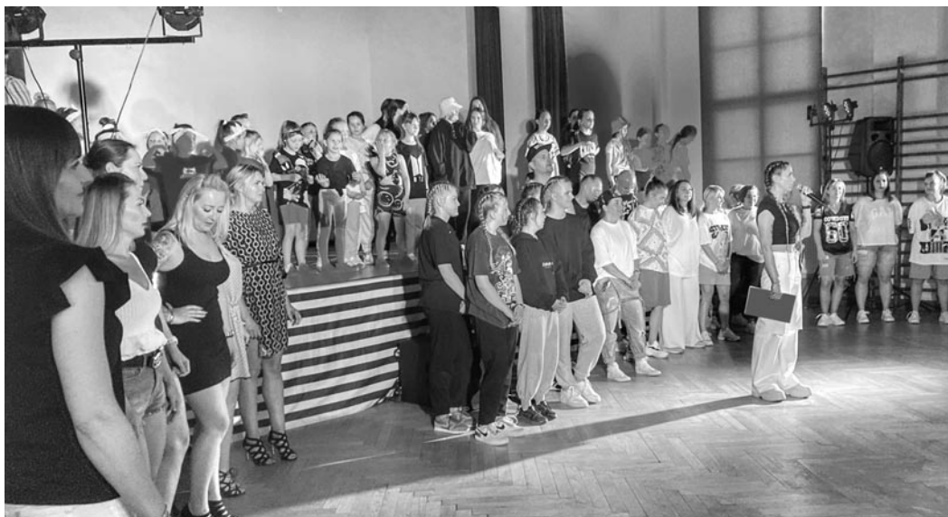
Gala Zakończenia Sezonu Tanecznego 2021/2022

szący nazwę Freaky Squad. Dziewczyny zrobiły prawdziwe show!