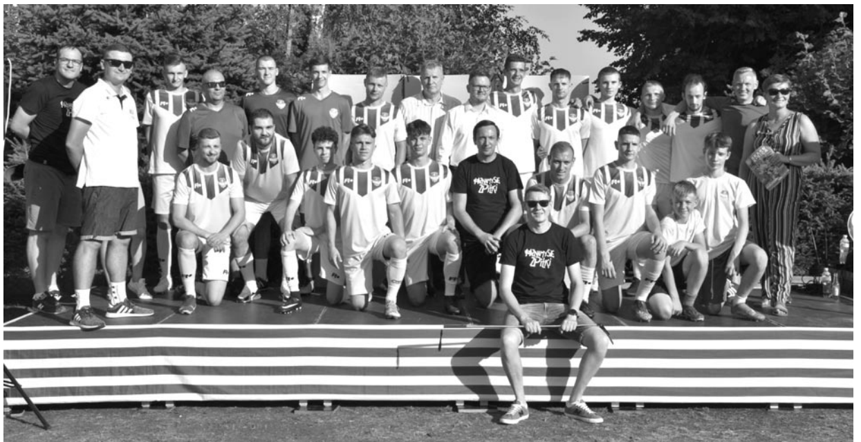
Prezentacja drużyn Olimpii podczas pikniku piłkarskiego forBet 4 ligi