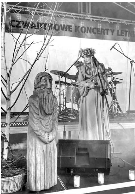
Zespół Chrust

7 lipca - Tego dnia rozpoczął się znany już wszystkim cykl Czwartkowych Koncertów Letnich . Jako pierwszy na scenie dziedzina ratusza zaprezentował się zespół Chrust , który swą nietuzinkową twórczością zachwycił olsztynecką publiczność. Folklor w nowoczesnym wydaniu bardzo Wam się spodobał, dlatego mamy nadzieję jeszcze gościć Chrust na naszej scenie.