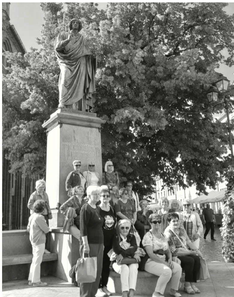
Wycieczka słuchaczy UTW w Olsztynku do Torunia

Cały montaż słowno-muzyczny reżyserowała pani Kasia Waluk. Romans poetki z Przyborą trwał 2 lata. Dzieje tej znajomości mogliśmy prześledzić wysłuchując fragmentów listów, jakie pisali do siebie kochankowie. Całość spektaklu była przeplatana piosenkami Osieckiej w wykonaniu zespołów wokalnych, dzia-