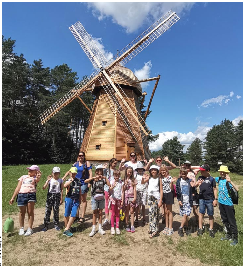
fol. MBP Olsztynek