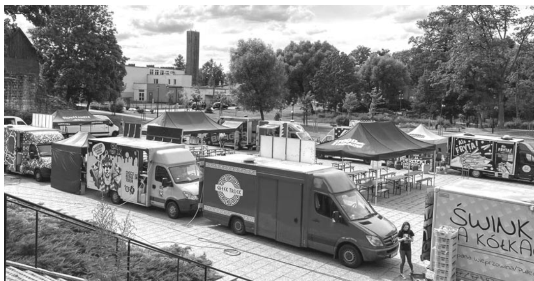
I Olsztynecki Festiwal Food Trucków

16 lipca - Festyn w Kurkach na szóstkę! Atrakcyjnym było końca - występy, krótka prelekcja o historii wsi, wspólne tańce, konkursy, wyścig kajakowy, przejażdżki konne, mini plener malarski, animacje dla dzieci, zawody sportowe, po-