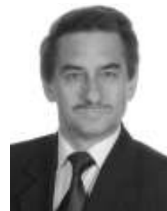
autor Bogumił Kuźniowski

miliony sto tysięcy ludzi. Z tego ponad 1830 tysięcy na wsi i tylko 253 tysiące w miastach. Ukraińcy stanowili 68%, czyli było ich 1420 tysięcy. Polaków żyło na Wołyniu około 350 tysięcy (16,6%), a Żydów, głównie w miastach oblicza się na 205 tysięcy (9,9%). Mieszkała tutaj jeszcze ludność niemiecka w ilości ok. 47 tysięcy, czeska – ok. 31 tysięcy oraz w mniejszej liczbie – Rosjanie, Ormianie, Romowie i inni. Koloniści niemieccy osiedlali się od końca XVIII wieku, nasilenie tego osadnictwa miało miejsce w II połowie XIX wieku. Na mocy porozumienia między III Rzeszą a Związkiem Radzieckim koloniści niemieccy wyjechali niemal w całości do Niemiec w końcu 1939 roku i w 1940 roku.