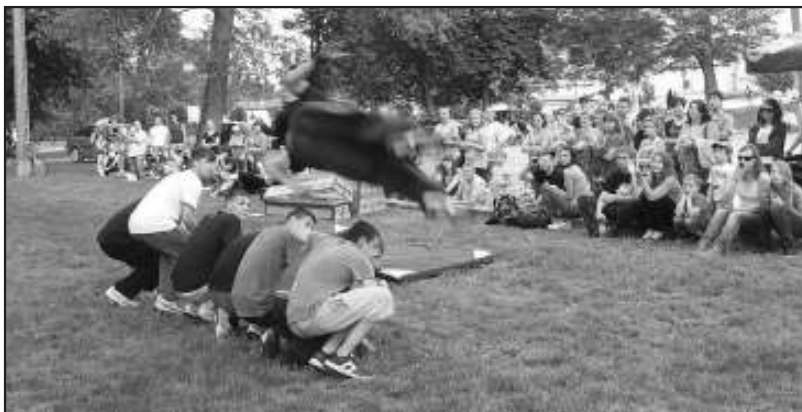
Street Art - parkour 3Run z Biskupca