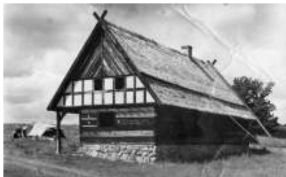
Chałupa ze wsi Nowe Kawkowo in situ, obiekt oryginalny z XIX w. i budowa w Muzeum /fot. Archiwum MBL-PE.