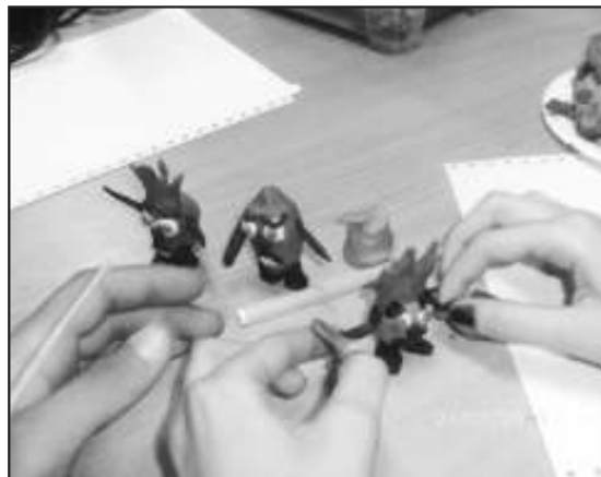
Tak powstaje animacja Moja przestrzeń

Część konkursowa naszego olsztyneckiego Młodzieżowego Festiwalu Filmowego nabiera tempa, kilkanaście ekip z całej Polski zadeklarowało udział, mają gotowe projekty, myślą nad realizacją nowych. Czekamy na zgłoszenia młodzieży z naszego regionu, a jest o co powalczyć. Zbliżają się wakacje, bierzcie kamery i filmujcie swoją przestrzeń, nie przejmujcie się brakiem znajomości warsztatu filmowego, liczy się pomysł, oryginalność i pasja. Regulamin i formularz zgłoszeniowy znajdują się na stronie www.olsztynek.pl