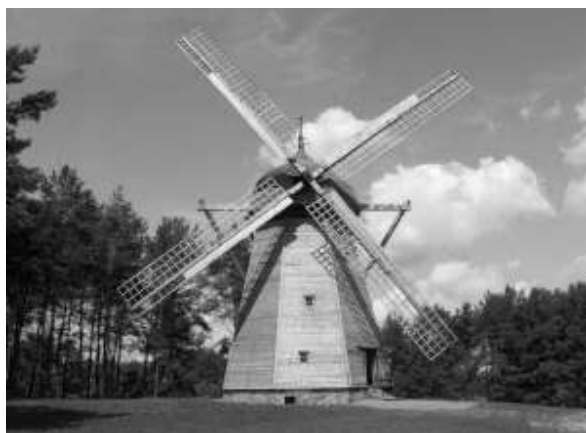
Wiatrak holender ze wsi Dobrocin, obiekt oryginalny z 2. poł. XIX w., budowa w Muzeum i stan obecny /fot. Archiwum MBL-PE.

wych. Zorganizowano pracownię stolarską. Teren muzeum opuścili dotychczasowi mieszkańcy, pozostawiając obiekty do wykorzystania na cele ekspozycyjne i gospodarcze.