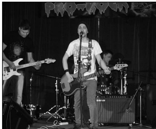
Zespół „Burning Ice”

uszach, jury (muzycy zespołu „Big Day” i „Kokabura”) znalazły „Bregma” z Gdańska /I miejsce/, „Headshot” z Olsztyna /III/ i nasz „Burning Ice” /II/.