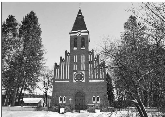
Kościół w Orzechowie