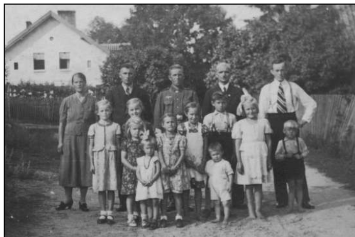
Pamiątkowe zdjęcie mieszkańców Orzechowa z okresu wojny

Orzechowo opustoszało, większość ludzi gdzieś zniknęła, inni ukrywali się lub siedzieli w domu, czekając na wiosnę i lepsze czasy. Nie wiedzieli, że najgorsze miało dopiero nadejść. W pierwszych dniach kwietnia, z sąsiedniej wsi Ząbnie, nadchodziła cała horda (ok. 100 osób) pijanych sowieckich żołnierzy. Ktoś wcześniej dostrzegł bandę Rosjan i wszczął alarm. Wszystkie młode kobiety i dziewczęta uciekły w panice do lasu. Sowietci w wielkim wrzaskiem wpadli do wsi. Biegali po domach, szukając gorzałki, jedzenia i kobiet. Niczego nie znaleźli, więc udali się do kościoła. Wylamali drzwi i wdarli się do środka. Kilku bojów weszło na chór. Bawili się, grając na organach tak zapamiętałe, że aż powyrywali klawisze i piszczałki. Inni wyciągali szaty liturgiczne i ornaty. Pozakładali je na siebie i tańczyli przed ołtarzem. Zabawa taka trwała dość długo, wreszcie, znudzeni, wyszli z kościoła. Na odchodne wrzucili dwa granaty do wnętrza świątyni. Od wybuchów wyleciały witraże w oknach, ale kościół nie zapalił się