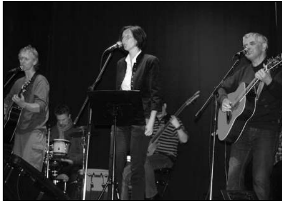
Koncert zespołu „Wolna Grupa Bukowina” w Kinie Grunwald.

7 III Organizowana przez Burmistrza impreza z okazji Dnia Kobiet ma w Gminie Olsztynek wieloletnią tradycję. Nowy wódarz Olsztyńska tradycję tę kontynuuje – wziął udział w święcie Pań, będąc też, jego głównym organizatorem. Artystycznie wspomogły przedsięwzięcie przedszkolaki, zespoły wokalne MGOK-u, Studio Fitness „Aerobit”, a jako gwiazda – cygański zespół „Hitano”.