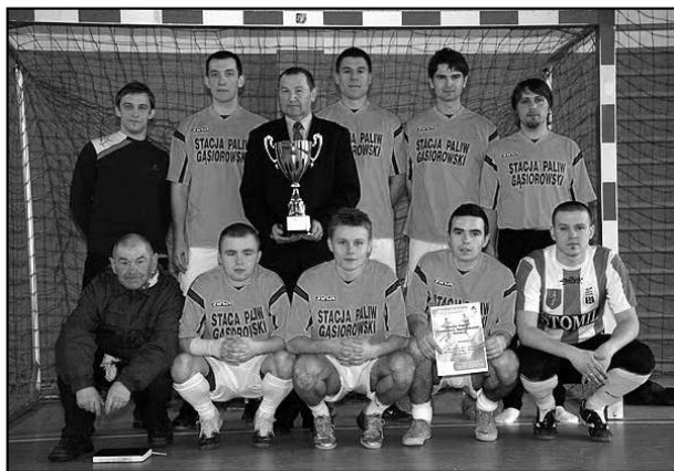
fol. Tomasz Bekuski

7 III Organizowana przez Burmistrza impreza z okazji Dnia Kobiet ma w Gminie Olsztynek wieloletnią tradycję. Nowy wódarz Olsztyńska tradycję tę kontynuuje – wziął udział w święcie Pań, będąc też, jego głównym organizatorem. Artystycznie wspomogły przedsięwzięcie przedszkolaki, zespoły wokalne MGOK-u, Studio Fitness „Aerobit”, a jako gwiazda – cygański zespół „Hitano”.