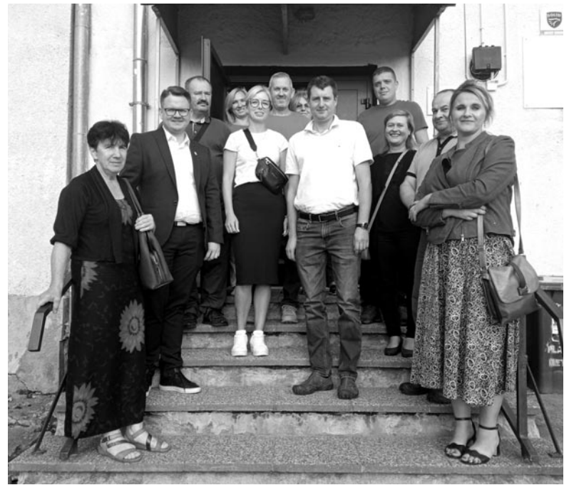
Wybory sołeckie w Sołectwie Łęciny