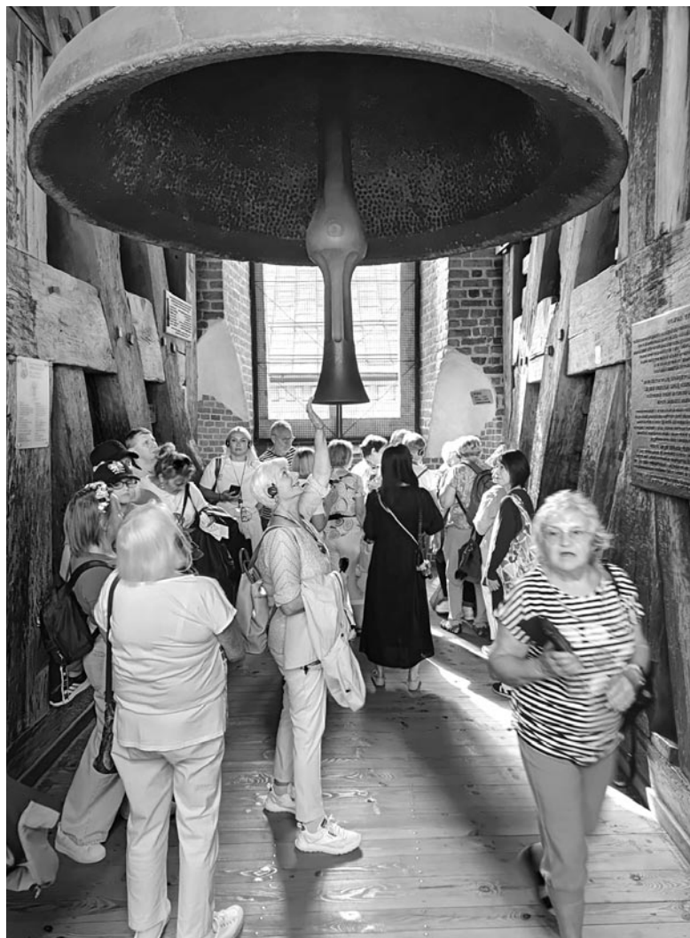
Wycieczka do Krakowa

Kolejny dzień poświęciliśmy na zwiedzanie Wzgórza Wawelskiego. Jest to jedno z najważniejszych miejsc w Polsce, będące symbolem historii i kultury narodowej. To dawna siedziba polskich królów, a także miejsce, gdzie znajdują się liczne zabytki oraz atrakcje turystyczne: Zamek Królewski na Wawelu – zachwycająca architektura, liczne kom-