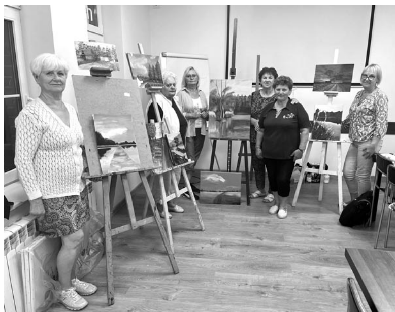
Uczestniczki pleneru malarskiego