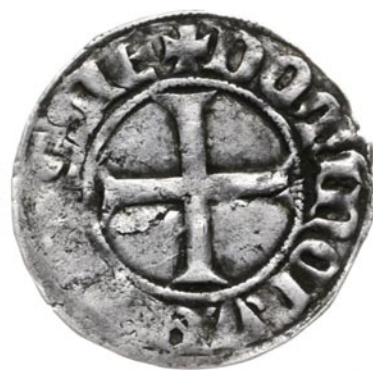
Rewers: Zakonny krzyż równoramienny W otoku: +DOMINORVMxPRUSSIE

miach piastowskich. Miał masę 0,75 grama i wartość czterech brakteatów. Wygląd zewnętrzny kwartników zapożyczono od ćwierć groszowych monet Flandrii. Heraldycznego lwa zastąpiono tarczą wielkiego mistrza, a rewers powtórzył wizerunek krzyża równoramiennego. Jest to moneta ceniona i pożądana na rynku kolek-