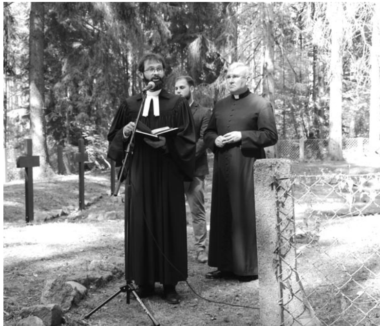
Ekumeniczna modlitwa za zmarłych

Po modlitwie za zmarłych zaproszeni goście wygłosili krótkie przemówienia, po których przedstawiłem zakres prac, jakie zostały wykonane na tym zabytkowym cmentarzu. Omawiane działania wykonywane były etapami, zgodnie w wytycznymi przekazanymi przez WUOZ w Olsz-