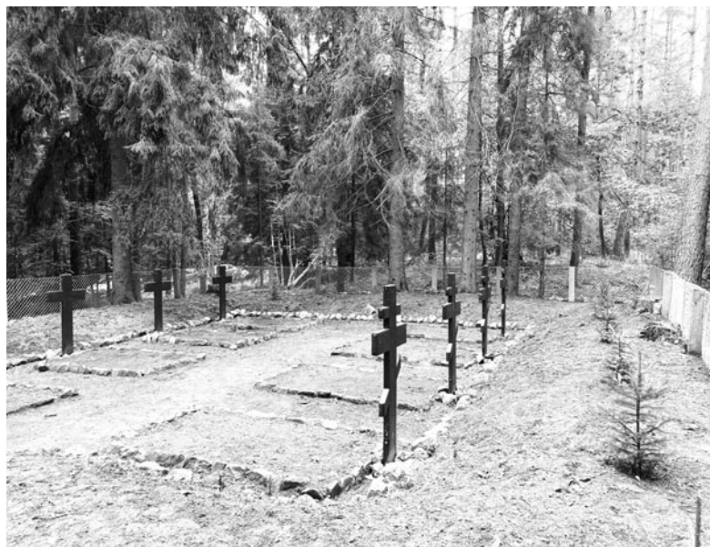
Cmentarz po zakończeniu prac konserwatorskich

tynie. W pierwszej kolejności zostały usunięte wszystkie suche i niepotrzebne drzewa, które rosły na terenie cmentarza, w tym duże ilości podszyciu i krzewów różnych gatunków. Podczas tych prac odkryte zostały oryginalne obramowania mogił, które przykryte były grubą warstwą igliwia, ziemi i darni. W sumie odkopanych zostało osiem kwater grzebalnych, o których wspominał Wiktor Knercer (1948–2023) w swojej książce „Cmentarze wojenne z okresu I wojny światowej w województwie olsztyńskim”. Autor współpracował z naszym stowarzyszeniem podczas prac związanych z rewitalizacją cmentarza wojennego w Swaderkach.