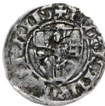
Awers: Tarcza Wielkiego Mistrza W otoku: +MAGISTERxGENERALIS

Kwartnik krzyżacki był wybijany w mennicy toruńskiej i pod względem wagowym i obrachunkowym nie był powiązany z bitymi na zie-