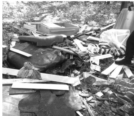
fol. SM Olsztynek

co skutkowało silnym zadymieniem żrącym dymem w całej miejscowości. Sprawę zgłoszono na numer alarmowy 112. Potrzebna była interwencja Straży Pożarnej i Policji. Sprawca tego czynu został ukarany mandatem karnym oraz zobowiązany do zawarcia umowy na odbiór odpadów.