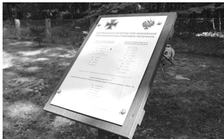
Tablica z listą poległych

Powyższy tekst dotyczący historii zdarzeń został przygotowany na potrzeby tablicy informacyjnej umieszczonej na cmentarzu w Swaderkach i w całości dostępny jest także na stronie internetowej Nadleśnictwa Olsztynek.