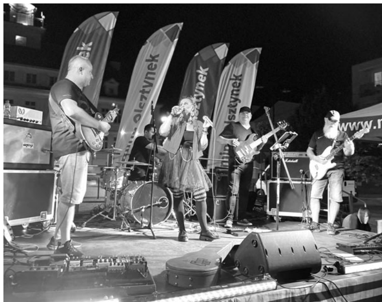
Zespół Radiomaszyna / Pożegnanie wakacji / fot. MDK Olsztynek

Efekt pracy będzie można obejrzeć już niebawem podczas wystawy poplenerowej w Miejskiej Bibliotece Publicznej w Olsztynku.