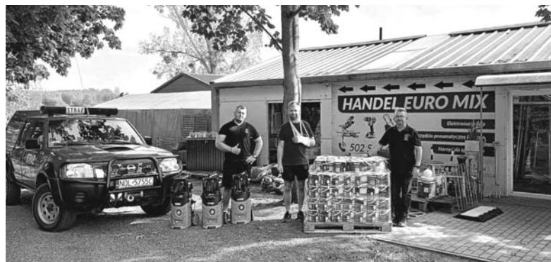
Olsztyńscy strażacy zorganizowali zbiórkę na rzecz osób poszkodowanych w wyniku powodzi i osobiście dostarczyli zebrane rzeczy na Dolny Śląsk

miejscowego zagrożenia (2), alarmu z monitoringu przeciwpożarowego (1). Olsztyńscy strażacy zabezpieczali także imprezę masową (1) oraz pomogli w zdjęciu z drzewa kota (1).