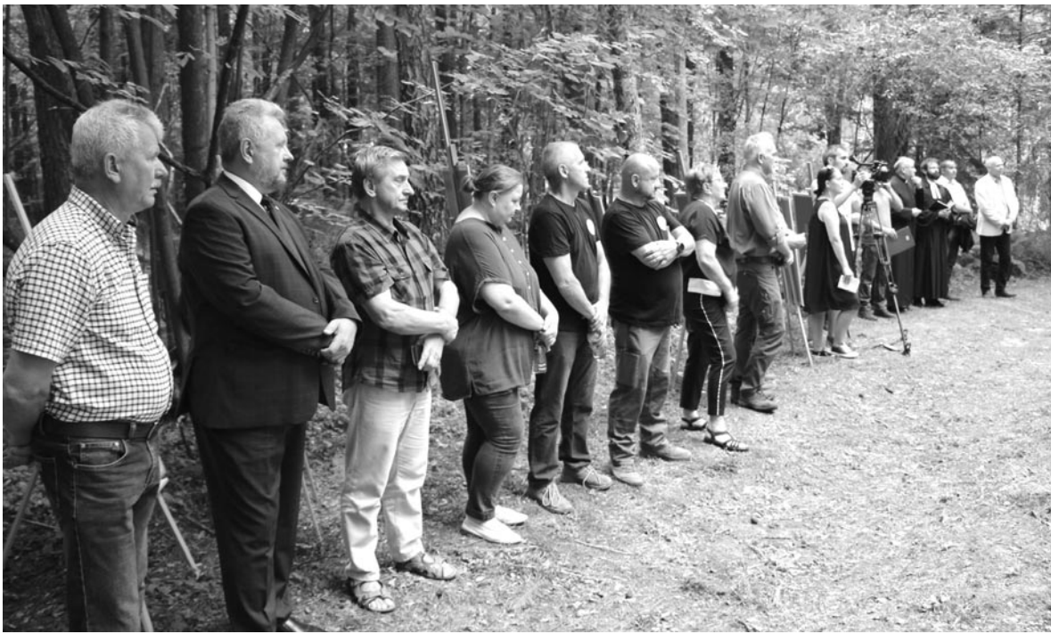
Goście na uroczystościach rocznicowych