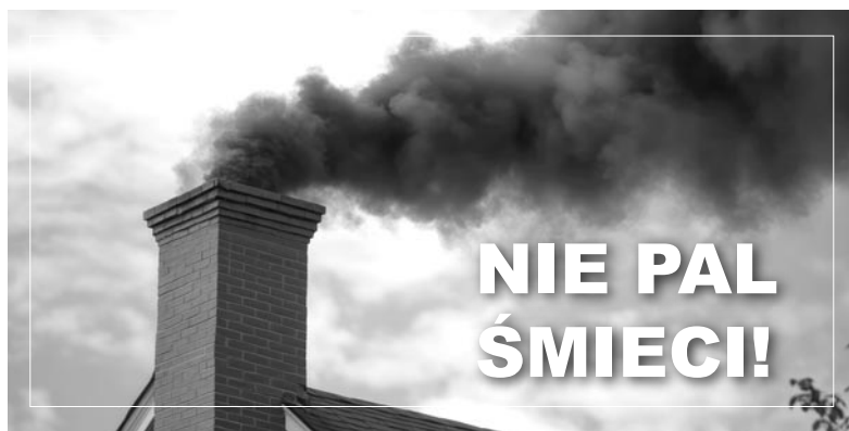
Palenie śmieci w piecach jest nielegalne i grozi mandatem karnym