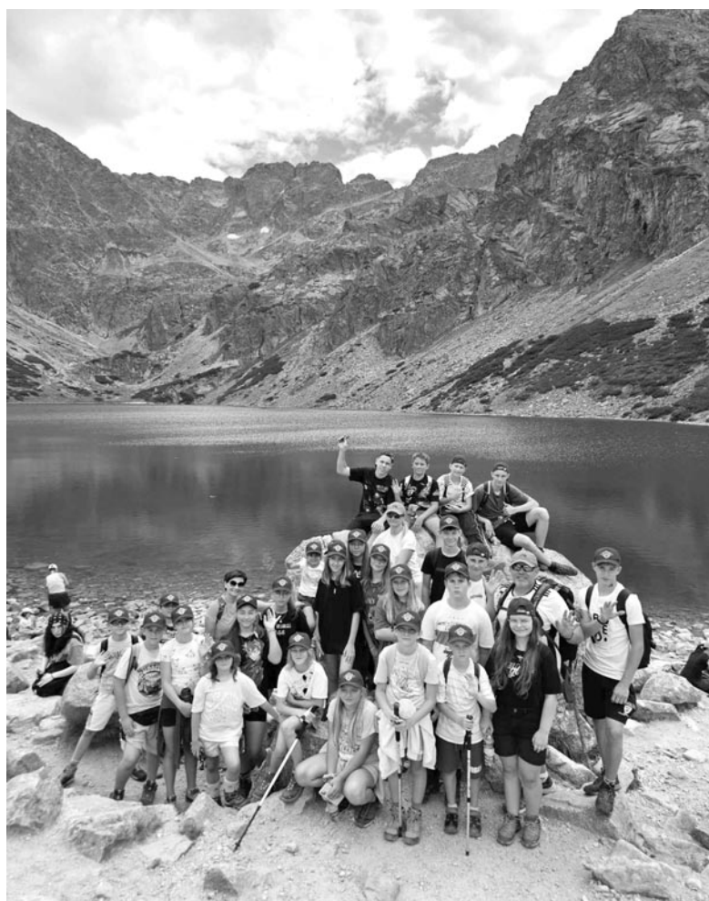
Grupa uczniów na tle Czarnego Stawu