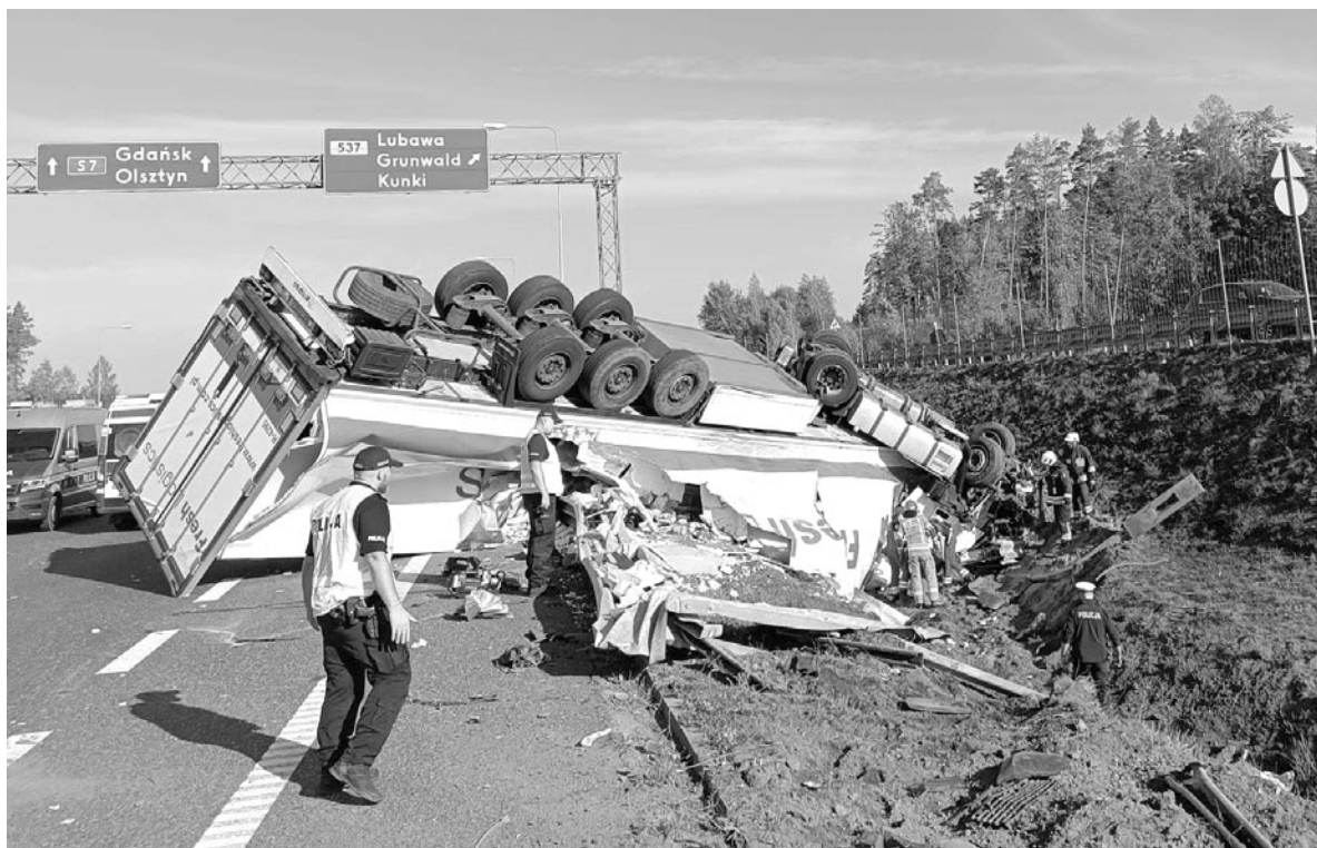
Tragiczny wypadek na wysokości węzła Pawłowo

OPRAC. NA PODSTAWIE INFORMACJI OSP W OLSZTYNKU