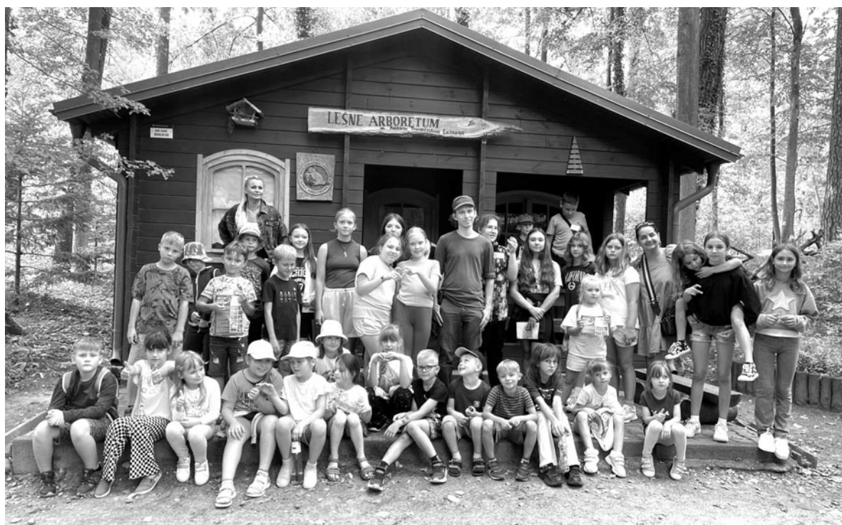
Lato z Kulturą

19-23 sierpnia. Lato z Kulturą. Pięciodniowe warsztaty kulturalne rozpoczęły się integracyjnymi zajęciami artystycznymi, a zakończyły mini plenerem malarskim w Muzeum Budownictwa Ludowego - Skansen. Dzieci uczestniczyły w zajęciach plastycznych, muzycznych i sportowych. Zwiedzały lokalne atrakcje, odwiedziły strażaków i brały udział w wycieczkach. Ogromne zainteresowanie wzbudziły Papugarnia i Kortosfera w Olsztynie oraz Leśne Arboretum Warmii i Mazur. Było też bardzo aktywnie podczas wizyty w olsztyńskim parku linowym. Lato z kulturą zakończyliśmy plenerem malarskim i mini koncertem perkusyjno-wokalnym, przygotowanym specjalnie dla rodziców.