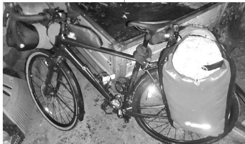
Policjanci odzyskali skradzione rowery i sprzęt kempingowy.

► 18.08. Oficer dyżurny Komendy Miejskiej Policji w Olsztynie otrzymał zgłoszenie o kradzieży dwóch rowerów na terenie jednego z pól namiotowych w gminie Olsztynek. Natychmiast na miejsce został wysłany policyjny patrol z Komisarzatu Policji w Olsztynku, który ustalił szczegóły zdarzenia. Z relacji pokrzywdzonego wynikało, że dwóch mężczyzn miało ukraść niezabezpieczone dwa rowery wraz z rzeczami kempingowymi i dokumentami. Pokrzywdzony wycenił łączną wartość strat na około 15 tysięcy złotych. Policjanci natychmiast rozpoczęli czynności w tej sprawie. Do ujęcia pierwszego z mężczyzn przyczynili się świadkowie. W trakcie czynności policjanci odzyskali skradzione rowery wraz z ekwipunkiem. Następnego dnia funkcjonariusze na terenie gminy