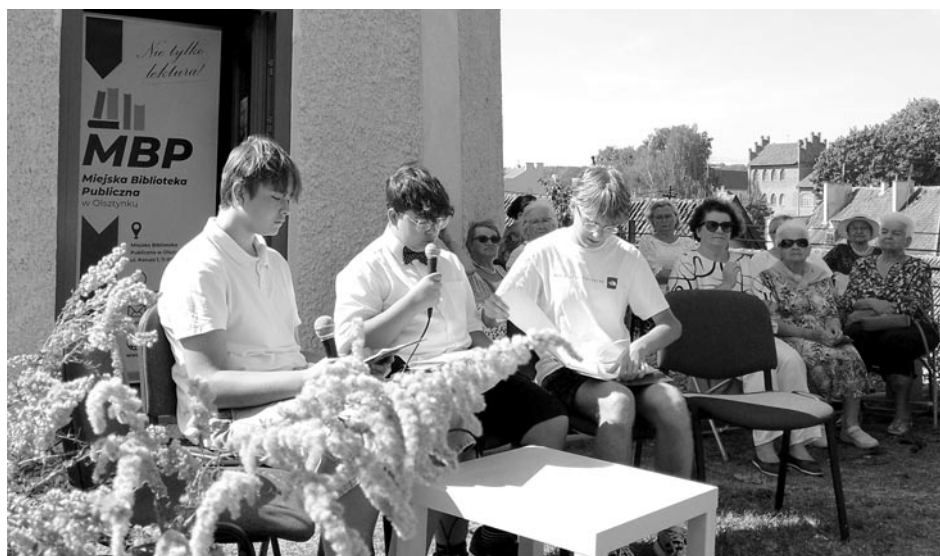
Narodowe Czytanie „Kordiana” Juliusza Słowackiego

Fragmenty dramatu czytali uczniowie szkół z naszej