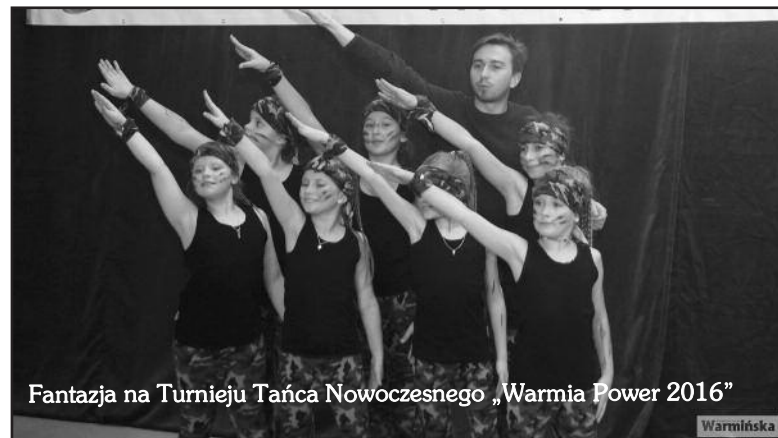
Fantazja na Turnieju Tańca Nowoczesnego „Warmia Power 2016”