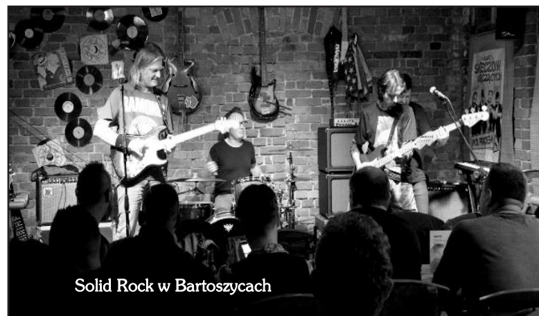
Solid Rock w Bartoszycach