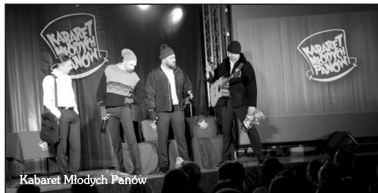
Kabaret Młodych Panów

15 stycznia - odbędzie się 25. Finał Wielkiej Orkiestry Świątecznej Pomocy. Wolontariuszy zachęcamy do zgłaszania się w Miejskiej Bibliotece Publicznej w Olsztynku.