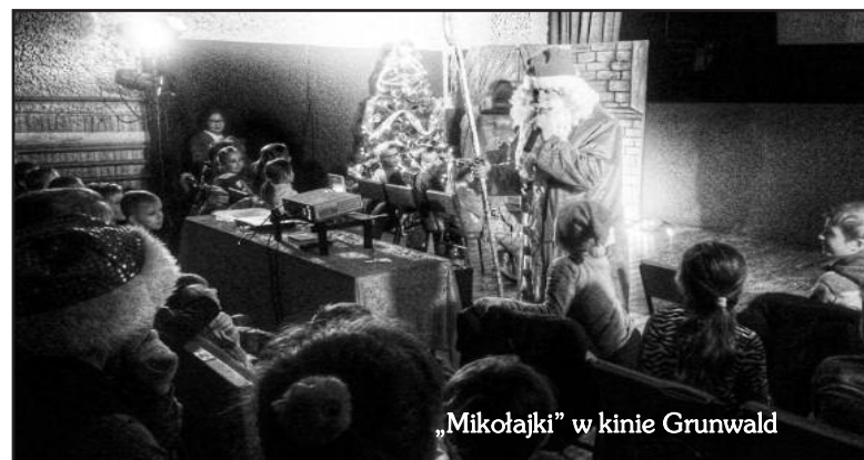
„Mikołajki” w kinie Grunwald