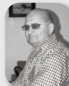
autor Czesław Kazimierz Bandzwołek

Cezar od dworzan się dowiaduje W Rzymie sobowtór jego się znajduje Podobny jest tak, że się ludzie myślą Widząc go , przed nim głowę chylą Cezar zapytał więc, czy sobowtóra mama Na dwór cesarza była zapraszana Sobowtór rzekł, że jak mu jest wiadomo To raczej ojca jego na dworzec goszczono