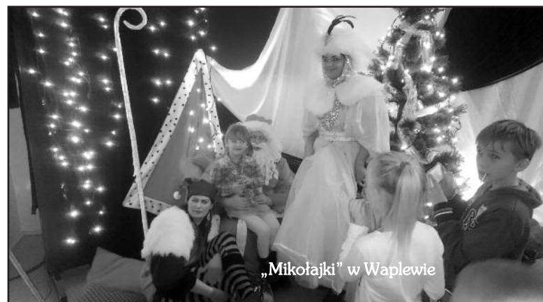
„Mikołajki” w Waplewie