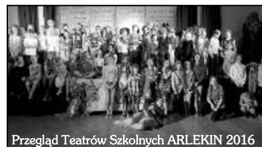
Przegląd Teatrów Szkolnych ARLEKIN 2016