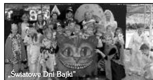
„Światowe Dni Bajki”