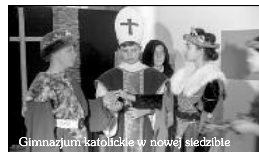
Gimnazjum katolickie w nowej siedzibie