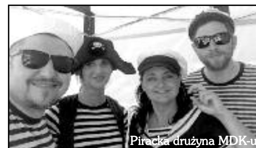
Piracka drużyna MDK-u