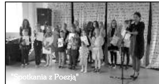
"Spotkania z Poezją"