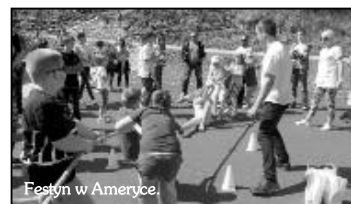
Festyn w Ameryce