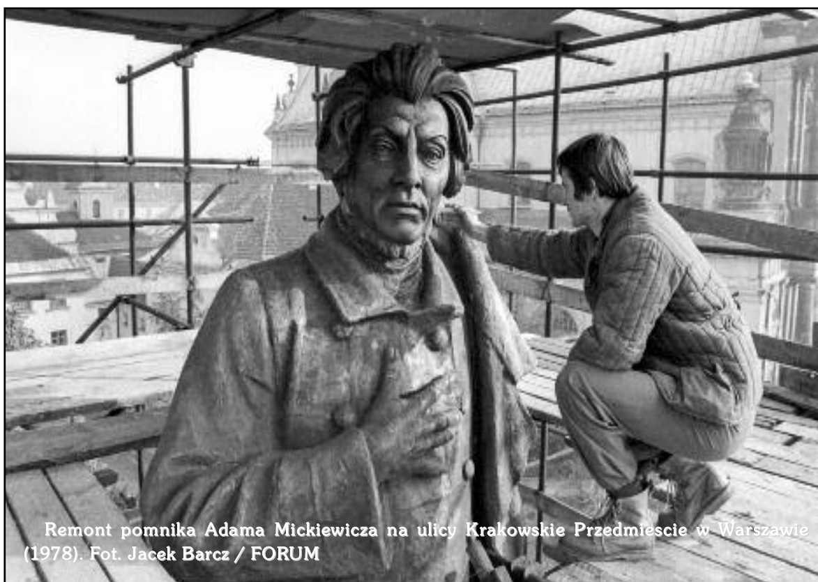
Remont pomnika Adama Mickiewicza na ulicy Krakowskie Przedmieście w Warszawie (1978).