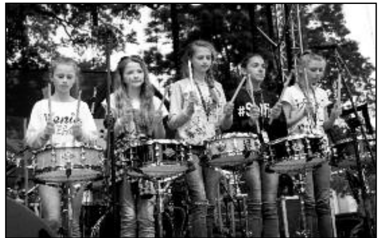
Grupa perkusyjna „Wariatki”