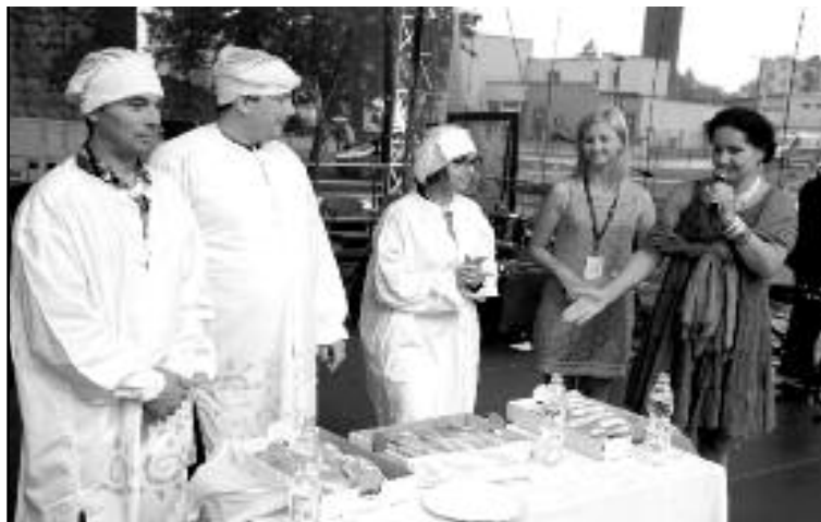
Konkurs Jedzenia Olsztyneckich Jagodzianek