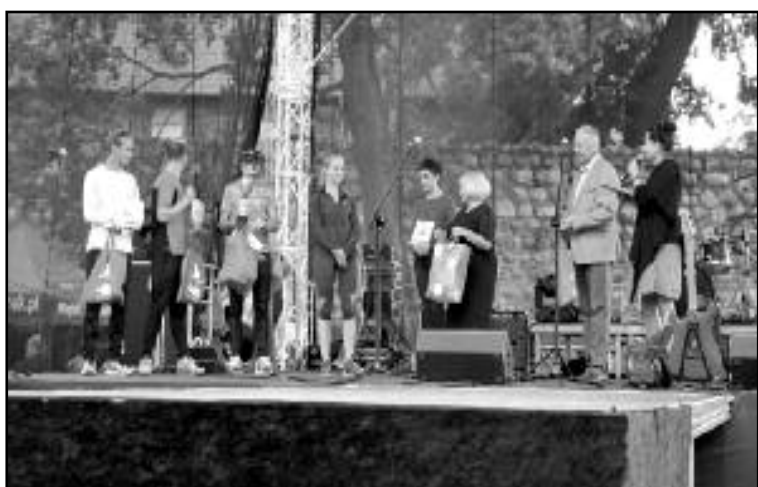
Zwycięzcy Biegu o Puchar Olsztyńka