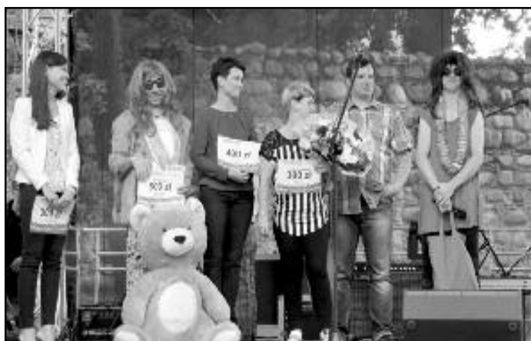
Bieg w szpilkach - wręczenie nagród