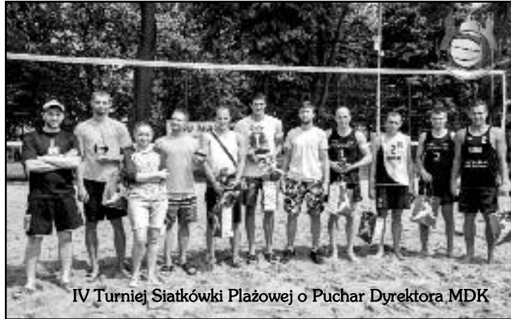
IV Turniej Siatkówki Plażowej o Puchar Dyrektora MDK

28.06 – kabareton. Salwami śmiechu zakończyliśmy tegoroczne Dni Olsztyńska. Jako pierwszy zaprezentował się kabaret 4 FA-LA. Kolejnym punktem progra-