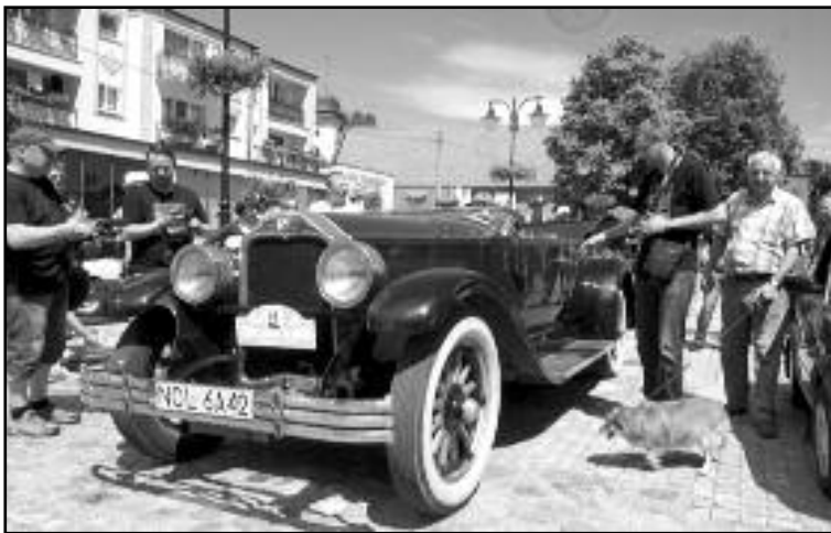
Zlot pojazdów zabytkowych