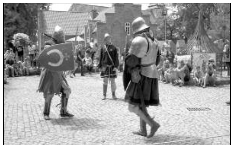
Turniej Rycerski o Topór Guntera von Hohensteina