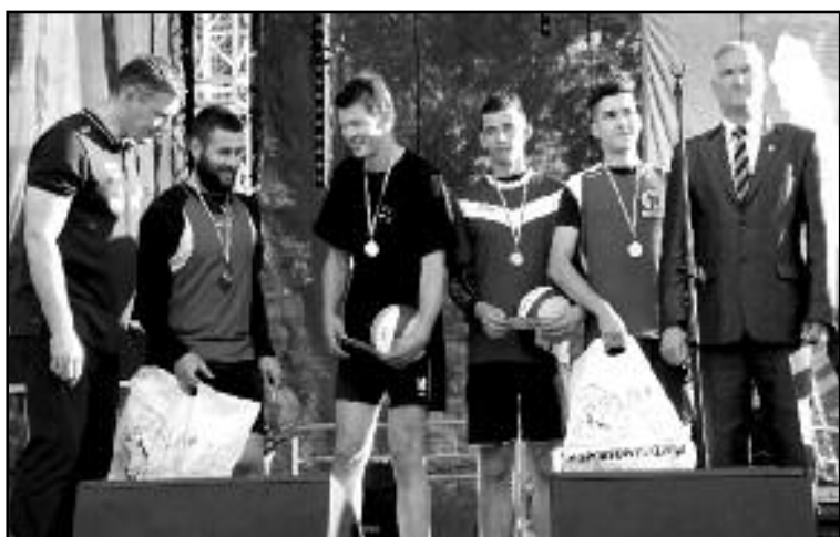
Turniej Siatkówki Piłkowej Pawła Papke