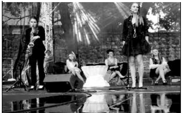
Widowisko muzyczne „Nie zapomnisz mnie”