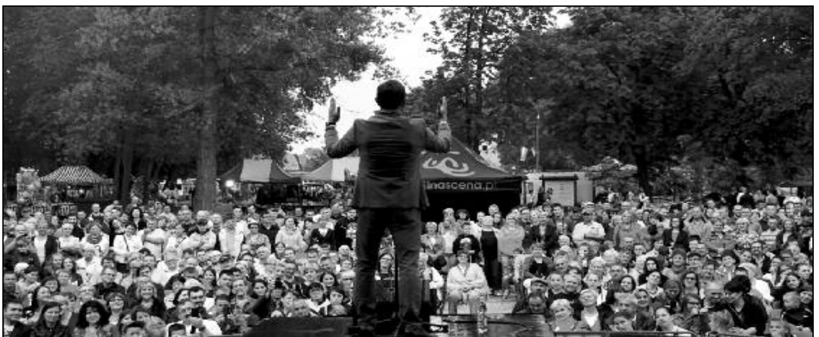
Kabareton - Cezary Pazura