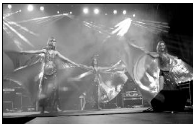
Grupa taneczna Flame