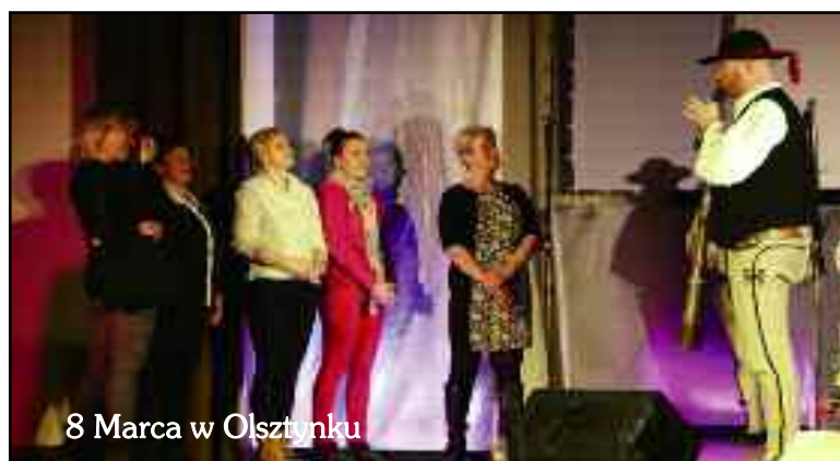
8 Marca w Olsztynku