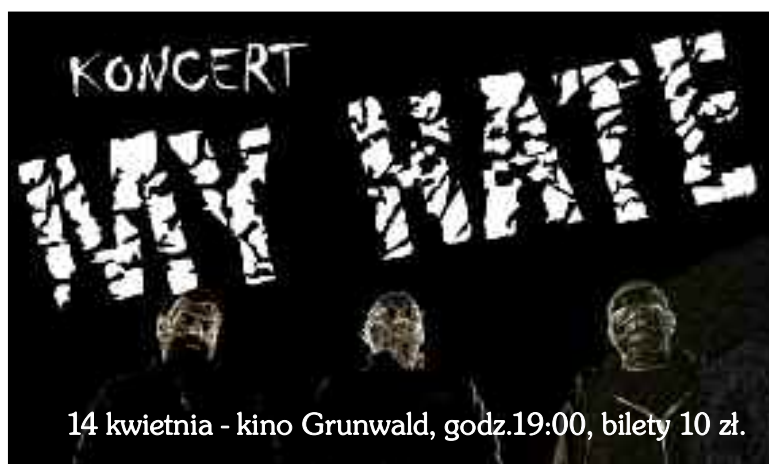
14 kwietnia - kino Grunwald, godz.19:00, bilety 10 zł.