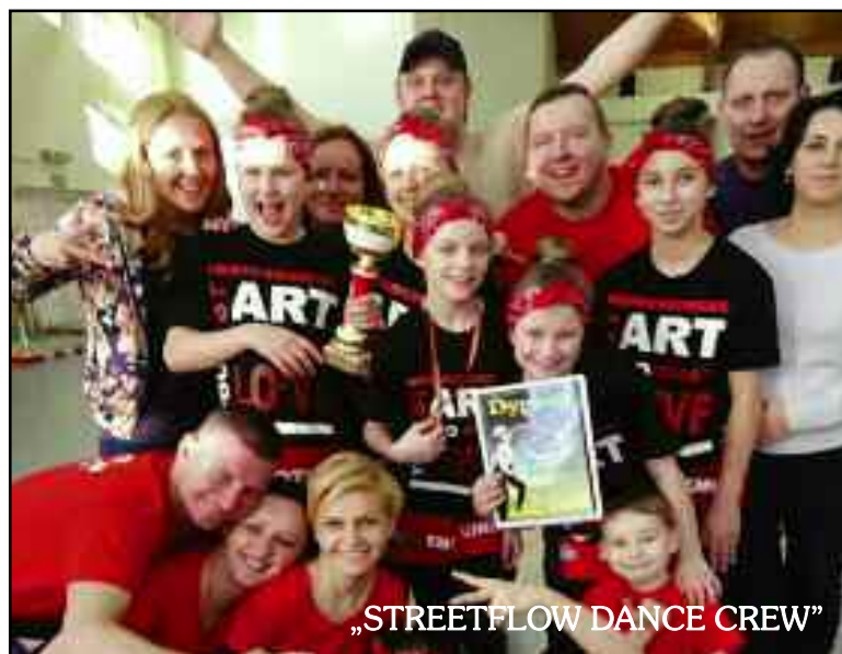
„STREETFLOW DANCE CREW”

15 kwietnia - Konkurs gitary klasycznej , MDK, godz. 13:00. Na bazie działalności naszego koła gitarowego rozpoczynamy nową imprezę. Zapraszamy miłośników łagodniejszego niż powyższego grania na występy gitarzystów z całego regionu.